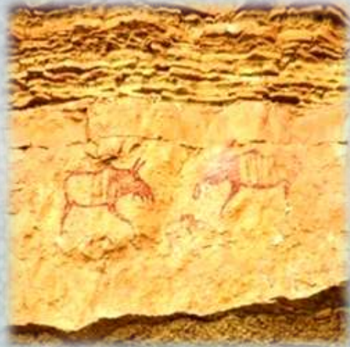
Рисунок на скале в Диринг-Юрях