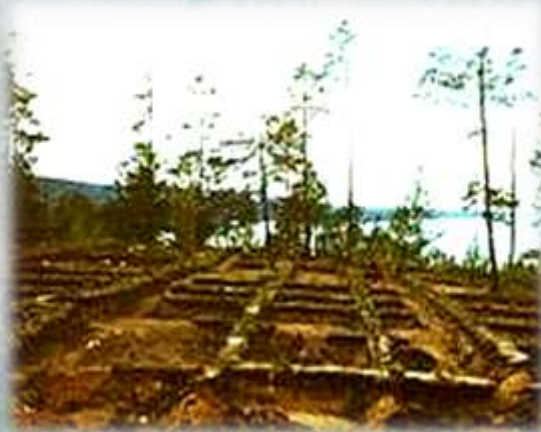
древнейшая стоянка человека Диринг-Юрях