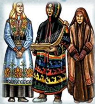
ханты и другие