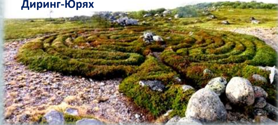
Каменный лабиринт Большого Заяцкого острова

Археологические находки свидетельствуют о том, что человек начал осваивать Арктику с самых древних эпох. На территории современной Якутии в 1982 году была обнаружена древнейшая стоянка человека Диринг-Юрях, возраст которой определяется как 2,9 млн. лет и не принимается многими учеными по причине фантастичности. Это открытие - серьезная заявка на то, что колыбель человечества находилась не в тропиках, а в 480 км от Северного полярного круга. Следы пребывания человека почти 30-тысячелетней давности обнаружены у рек Яна (самая северная) и Берелех в Якутии, а также близ деревни Бызовая в Республике Коми. До сих пор удалённые северные острова России привлекают путешественников и учёных, которые хотят разрешить их загадку и познать смысл лабиринтов.