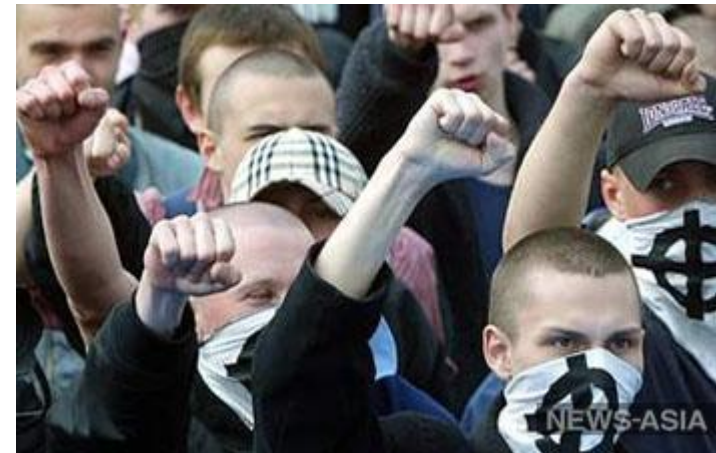
В Костроме скинхеды напали на неформалов